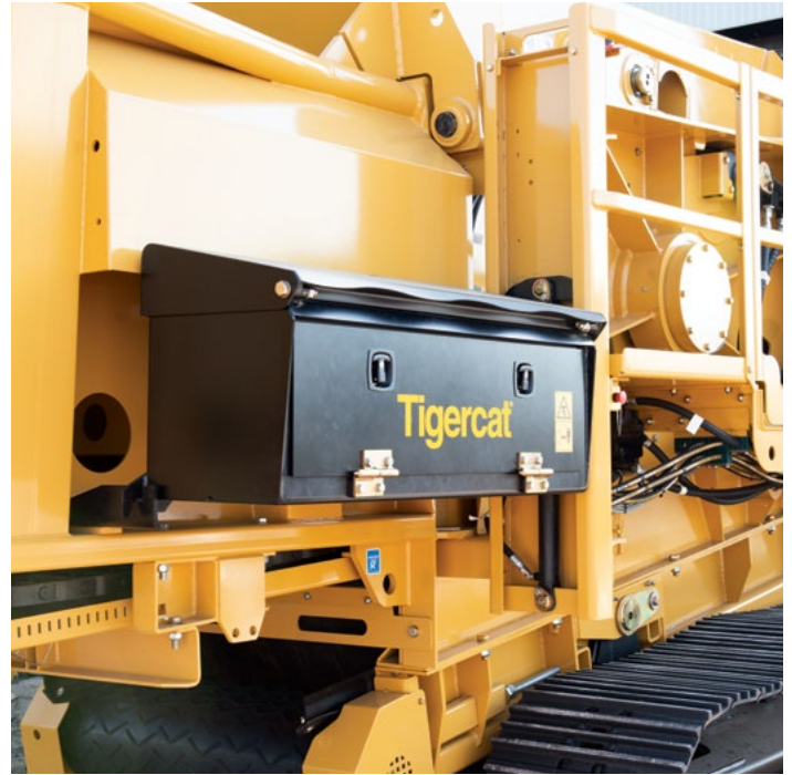
Caja de herramientas que sube y baja hidráulicamente.

TODA LA PARTE INFERIOR DEL TRANSPORTADOR DE DESCARGA ESTÁ ABIERTA PARA EVITAR LA ACUMULACIÓN DE MATERIAL.